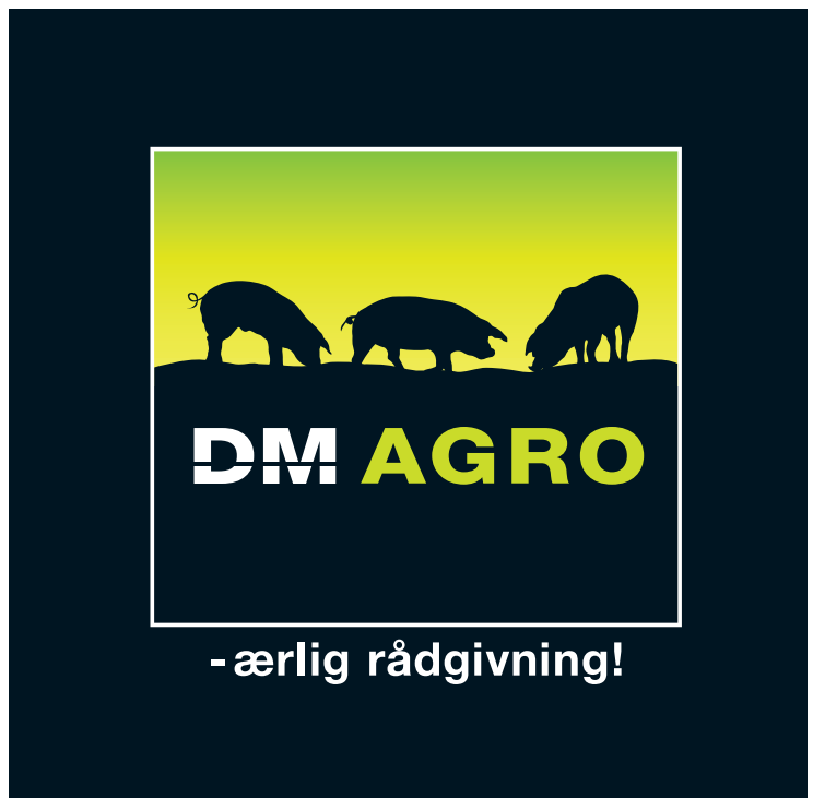
Anvendelse af logo tværformat i CMYK på hvid baggrund.